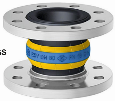
Type ERV-GS HNBR

GELBSTAHL HNBR Gummikompensatoren für Mineralölprodukte, DIN-Kraftstoffe mit bis zu 50% Aromatenanteil, Kühlwasser mit ölhaltigem Korrosionsschutz, Schmier- bzw. Hydrauliköle und Seewasser. Sehr gute Alterungs-, Witterungs- und Ozonbeständigkeit. Temperaturbereich (medienabhängig) -35°C bis +100°C, kurzzeitig bis +120°C. Flammbeständig nach ISO 15540 bis 30 Min. bei 800°C. Elektrisch ableitfähig. Innen : HNBR (Nitril), nahtlos, hoch abriebfest Druckträger : Verzinkter Stahldrahtcord Außen : Chloropren CR Kennzeichnung : Gelb-blau-gelbe Ringe, ERV DN ..., PN ..., Herstelldatum Flansche 1) : Drehbar, DIN PN 10/16, Stahl, verzinkt