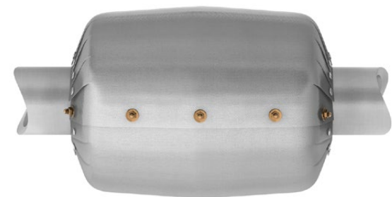
geschlossen / closed