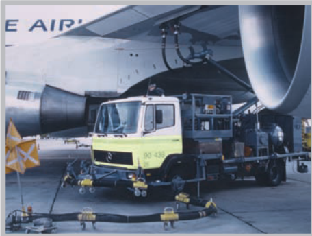
Hydranten-Fahrzeug im Einsatz - Schlauch mit herkömmlicher Ring-Kennzeichnung

Die NEON-Spirale umschlingt fortlaufend die ganze Schlauchleitung; sie ist dadurch zwischen den vielen kleinen Rollböcken sehr gut zu erkennen.