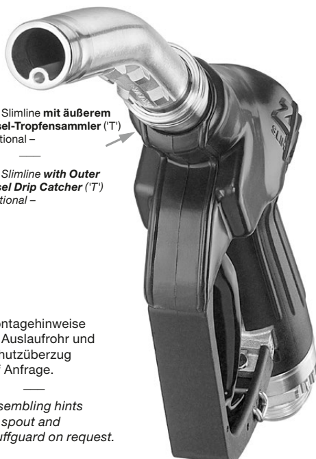
ZVA Slimline mit äußerem Diesel-Tropfensammler ('T') – optional –