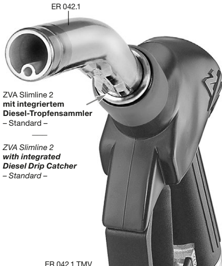
ZVA Slimline 2 mit integriertem Diesel-Tropfensammler – Standard –