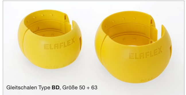
Gleitschalen Type BD , Größe 50 + 63

Für weitere Details sprechen Sie bitte unseren Verkauf an.