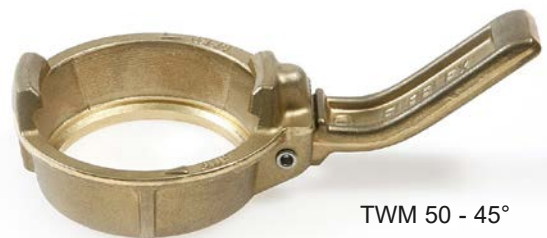
TWM 50 - 45°