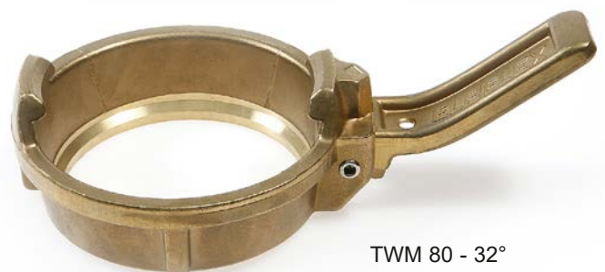
TWM 80 - 32°