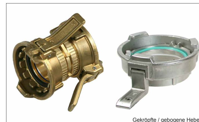
Gekröpfte / gebogene Hebel

Gekröpfte bzw. gebogene Hebel am Spannring sind die Lösung dieses Problems. Erhältlich in Messing oder Edelstahlausführung.