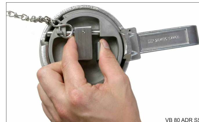
VB 80 ADR SS

Ein "VB 80" Blindstopfen aus Edelstahl, als dritte Absperarmatur mit Druckentlastungsventil. Seit 2007 sehen die Vorschriften der ADR vor, dass der Blindstopfen des Auslaufstutzens nur vollständig von der Mutterkupplung entnommen werden darf, wenn zuvor eine gefahrlose Druckentlastung stattfand. Bei diesem Blindstopfen entriegelt der Tankwagenfahrer mit einer Hand den Mechanismus, das integrierte Druckentlastungsventil entspannt den eventuell vorhandenen Überdruck. Der Blindstopfen kann gefahrlos entnommen werden.