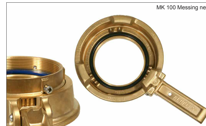
MK 100 Messing neu

Die 4" Mutterkupplung aus Messing wurde durch eine technisch verbesserte Version ersetzt. Der bisherige, separate Zahnkranz ist jetzt voll in den Dichtring (Kronenstück) integriert - zur Montage sind keine Spezialzangen mehr notwendig, und die erwartete Lebensdauer steigt.