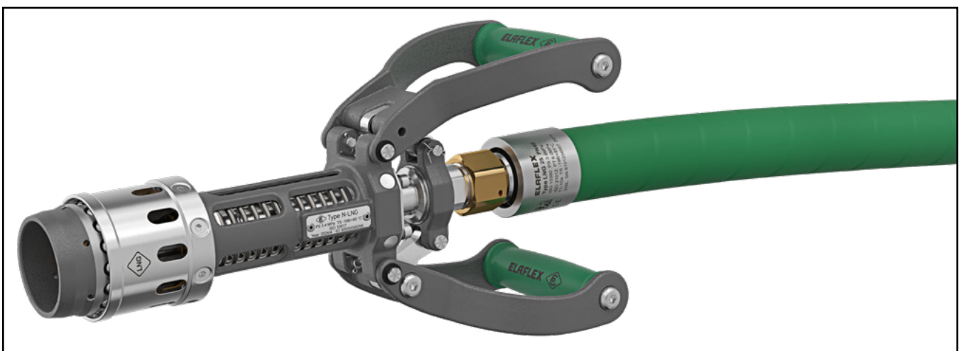
N-LNG Zapfventil – zentrale Komponente des ELAFLEX LNG-Betankungssystems für LKW