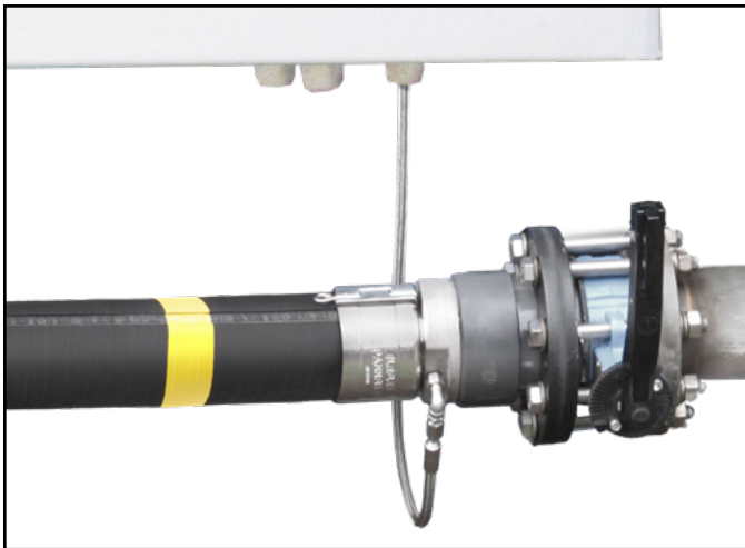
Doppelwandige Schlauchleitungslösung ELAFLEX DualSafe mit Leckanzeigetechnik von SGB