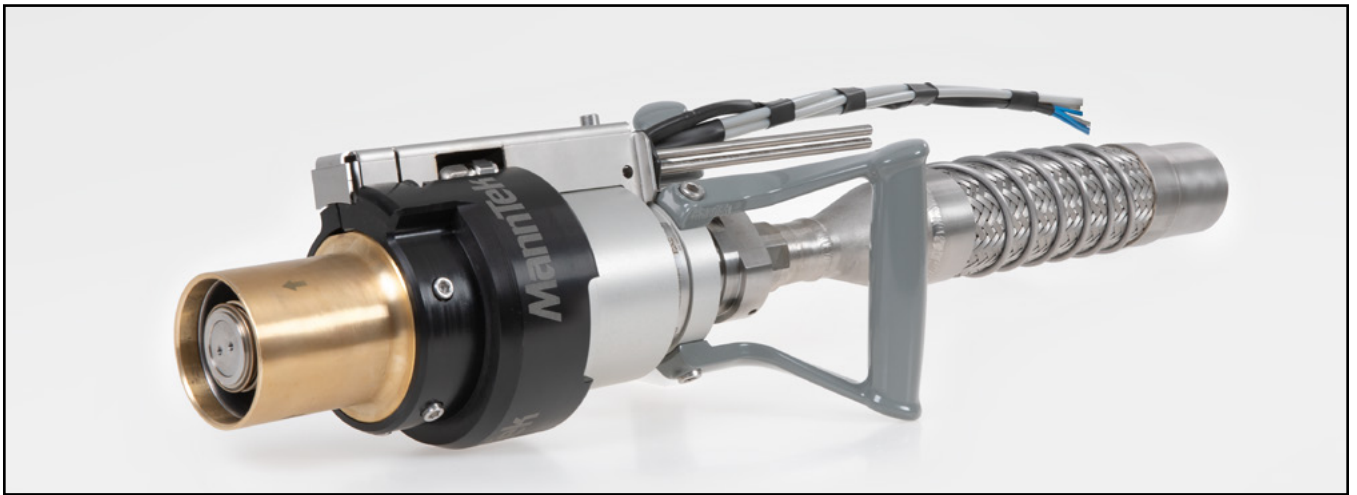
N-LH2-P – halbautomatisches, pneumatisches Zapfventil von MannTek zur Betankung von LKW mit kryogenem Wasserstoff (LH2)