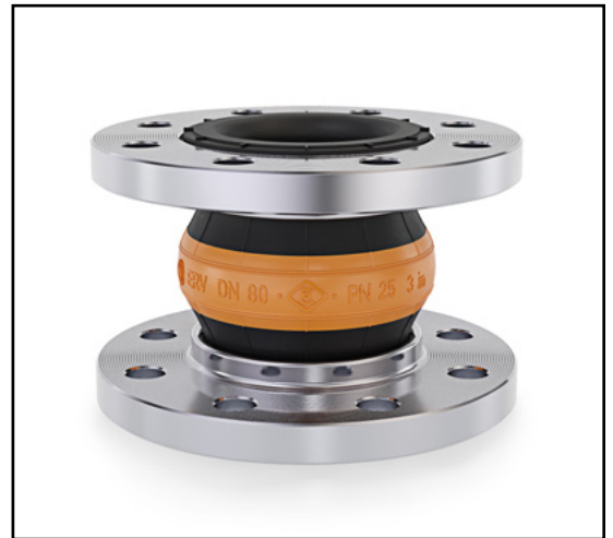
Gumikompensatoren (ERV) für LPG und DME von ELAFLEX