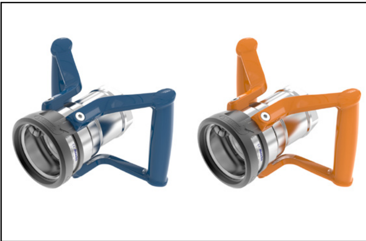
Trockenkupplungen und Abreißkupplungen für flüssige (DDC 2.0) und gasförmige (DGC 2.0) Medien von MannTek