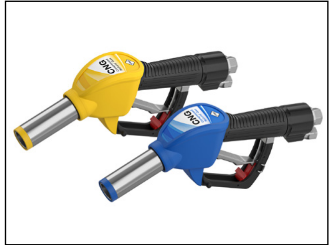
N-CNG-Zapfventil für 250 bar/3.600 psi (US Standard, gelb) und 207 bar/3.000 psi (EU Standard, blau) von ELAFLEX