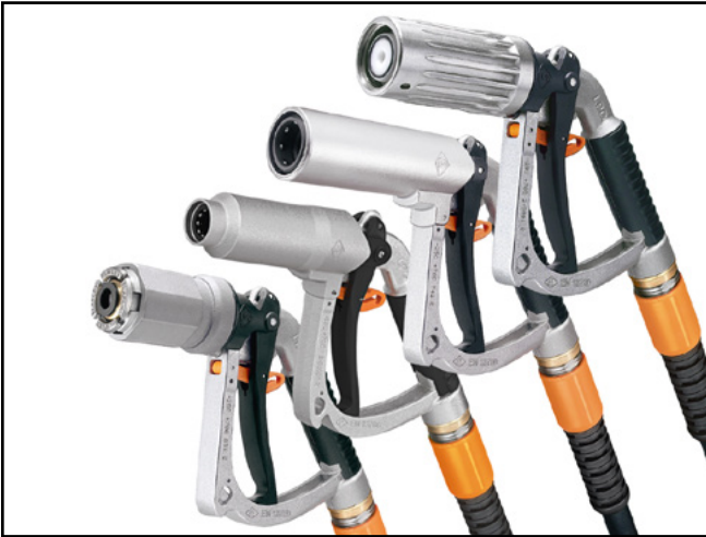
Zapfschläuche, Abreißkupplungen, ZVG 2 LPG Zapfventil für DISH-, K-, EURO- und ACME-Anschlüsse von ELAFLEX